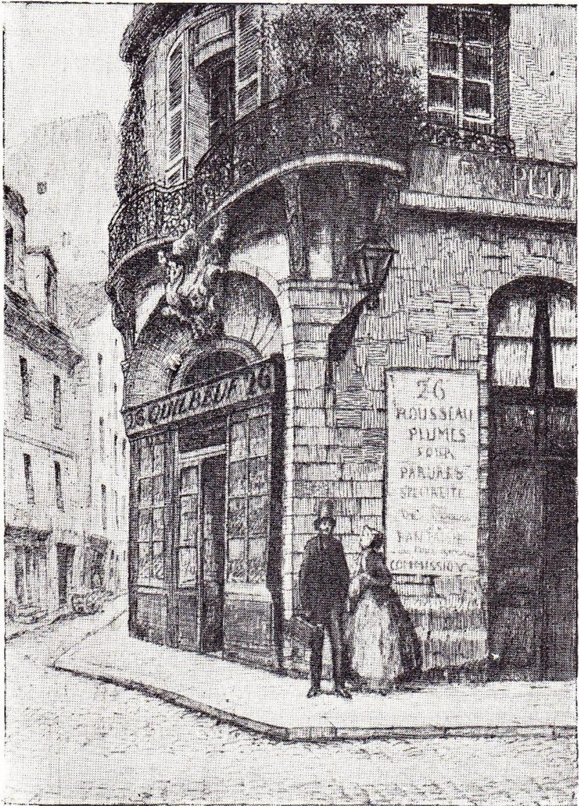
RUE THÉVENOT. — IMPASSE DE L'ÉTOILE. D'après une eau-forte de MARTIAL (POTHÉMONT.) (Collection Charles Olivié.)